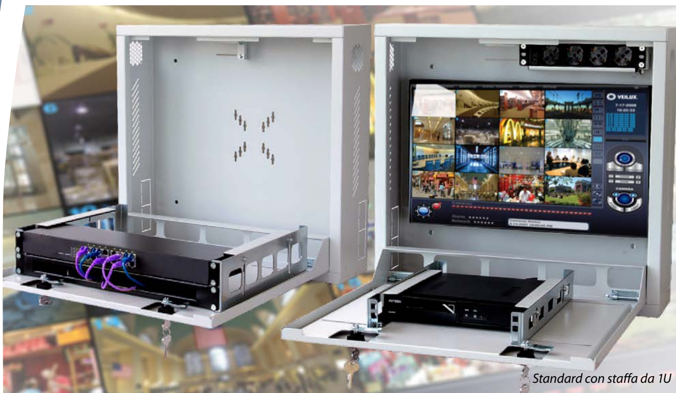
Standard con staffa da 1U

Protegge gli apparati DVR e di videosorveglianza dagli accessi indesiderati F4275